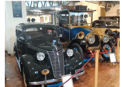
3. Tag: Museo dell'auto

La Dolce Vita auf 4 Rädern - dem Genuss auf der (Fahr)Spur!