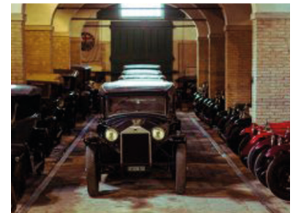
2. Tag: Panzano

La Dolce Vita auf 4 Rädern - dem Genuss auf der (Fahr)Spur!