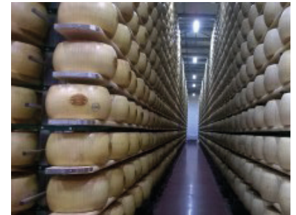
3. Tag: Käserei

Um 19.30 Uhr starten wir mit den eigenen Autos zum Abendessen auf einem Bauernhof, den wir im Sonnenuntergang durch die malerischen Hügel von Modena erreichen werden (ca. 20 km weit entfernt von Modena).