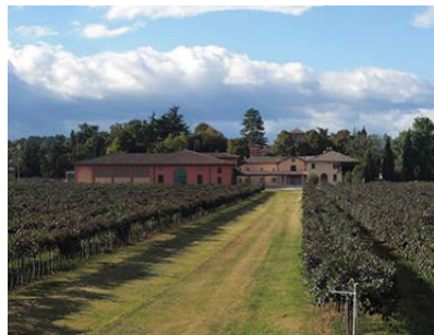
4. Tag: Cleto Chiarli