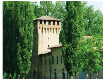
2. Tag: Collezione d'auto e moto d'epoca R.