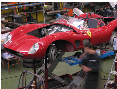
4. Tag: Carrozzeria Brandoli