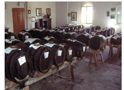
3. Tag: Acetica Galli

Wenn jemand den Aufenthalt verlängern möchte, können wir das Zimmer im Hotel zu den selben Bedingungen reservieren. Bitte auf Ihrer Anmeldung vermerken.