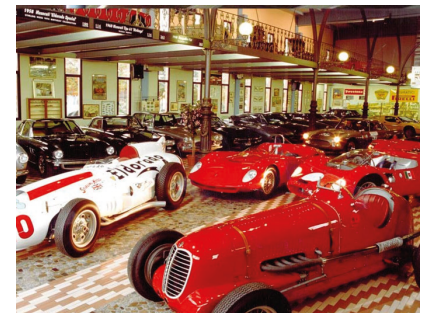
3. Tag: Maserati und Motorräderversammlung