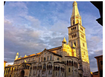
2. Tag: Sehenswürdigkeit