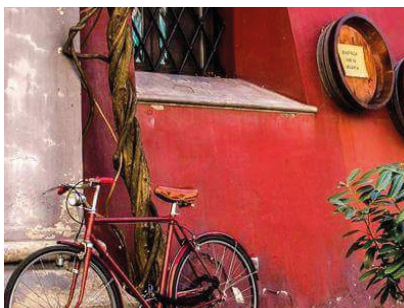
2. Tag: Collezione d'auto e moto d'epoca R.